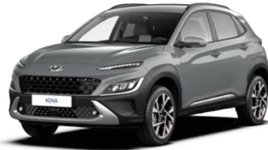
Galactic Gray Metallic (R3G)