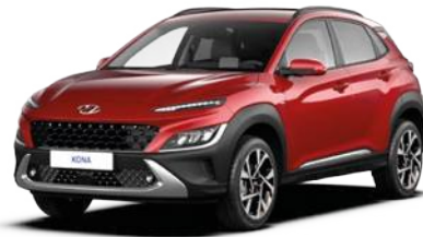
Pulse Red Pearl (Y2R)