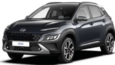
Dark Knight Gray Pearl (YG7)