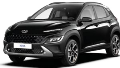
Phantom Black Pearl (MZH)