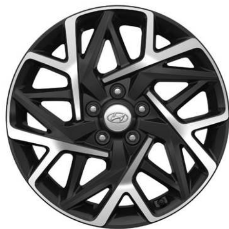
Ζάντες αλουμινίου 18" (Full Hybrid)