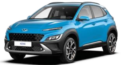
Dive Blue (UTK)*