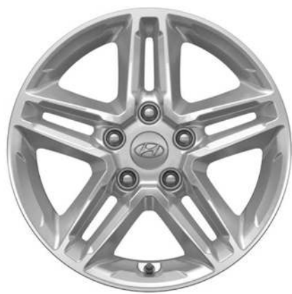
Ζάντες αλουμινίου 16"

Το νέο KONA διατίθεται τώρα με μία σειρά κοψών ζαντών αλουμινίου νέας σχεδίασης 16", 17" και δίχρωμων 18", που ολοκληρώνουν το δυναμικό του προφίλ.