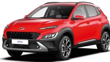
Ignite Red (MFR)*