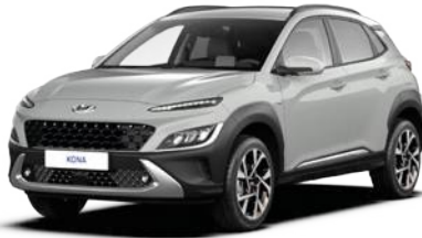
Cyber Gray Metallic (C5G)