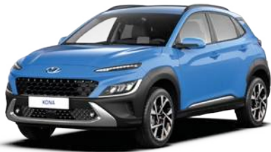
Surf Blue Metallic (V7U)