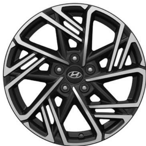
Ζάντες αλουμινίου 18" (N Line)