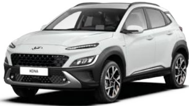
Atlas White (SAW)