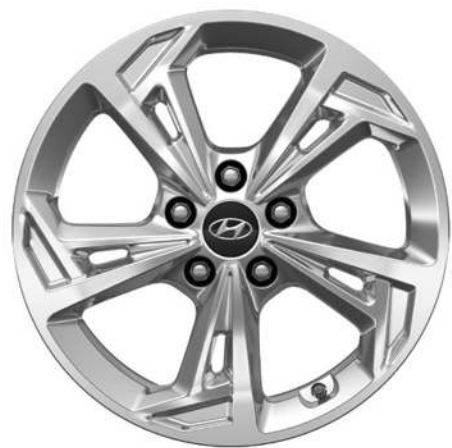
Ζάντες αλουμινίου 17"