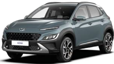
Jungle Green Pearl (Y7H)