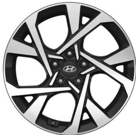
Ζάντες αλουμινίου 18"