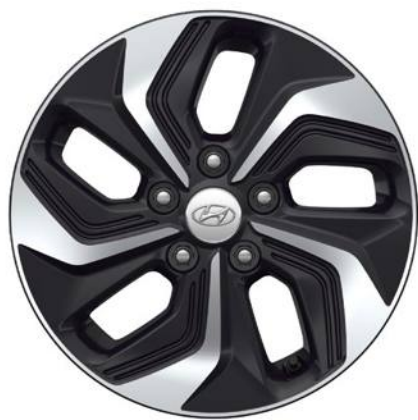
Ζάντες αλουμινίου 16" (Full Hybrid)